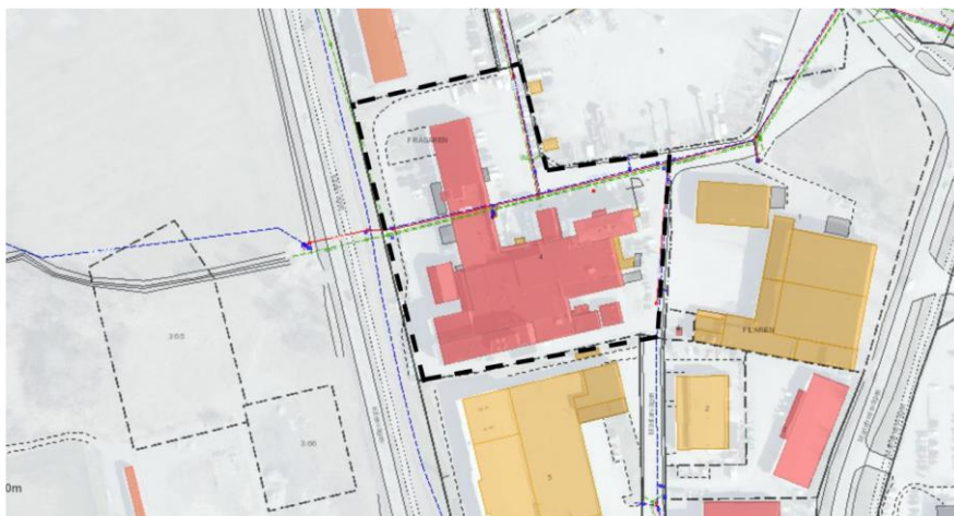
Figur 1. Befintligt VA och VO